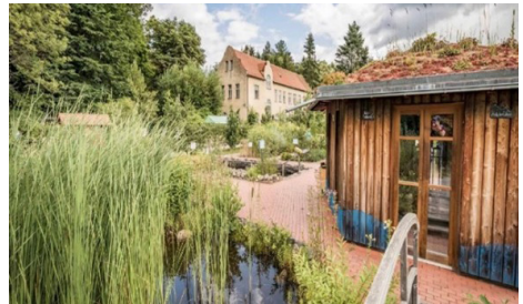
Im Klostergarten der Abtei