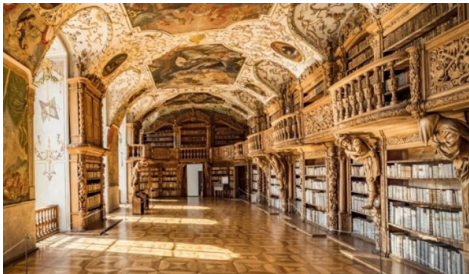
Weltweit einmalige barocke Bibliothek

Nach der Besichtigung der prächtigen Basilika und weltberühmten Stiftsbibliothek, erlebt jeder für sich die „Klostergärten für alle Sinne“ der Zisterinsinnen: Bauerngarten, Mariengarten, Heilkräutergarten nach Hildegard von Bingen und Pfarrer Kneipp. In der Klosterwirtschaft-bekannt durch die Sendung im Bayerischen Fernsehen „Landgasthäuser-Klosterschänken“- kehren wir zu Mittag ein.